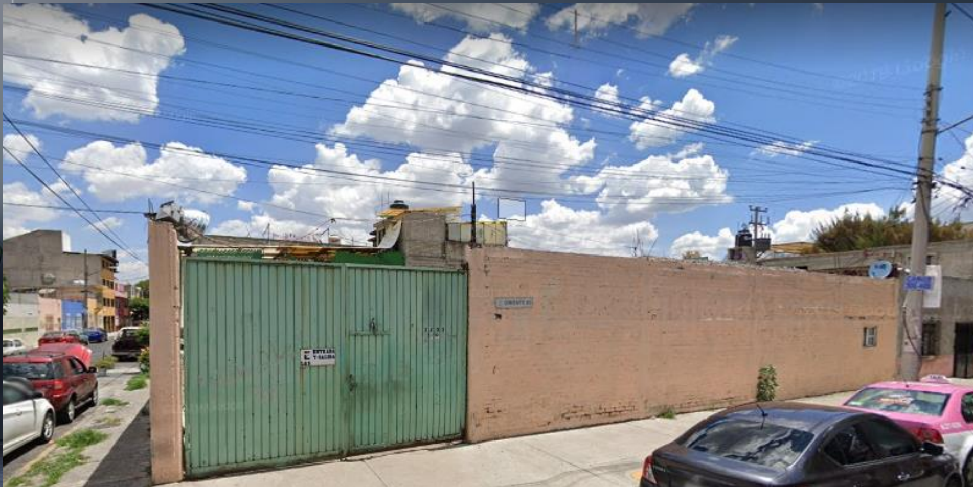
FOTO DEL PREDIO